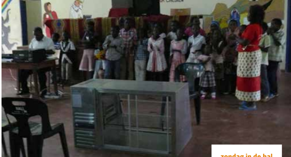
zondag in de hal

evangelisatiecentra. Naast het evangelisatiecentrum in Milala is er dit jaar een centrum geopend in Mkokodzi. Deze twee centra organiseren zichzelf en doen ook evangelisatiewerk in andere dorpen, waarbij het reformatorische gedachtengoed wordt gebracht.