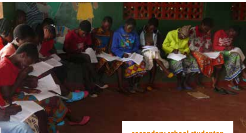
secondary school studenten

meer dan 5 kilometer lopen om de school te bereiken. Khombwe is een uitgestrekt gebied waar geen hulp organisaties geweest zijn. Er is daarom een grote behoefte aan hulp, met name in de omliggende dorpen.