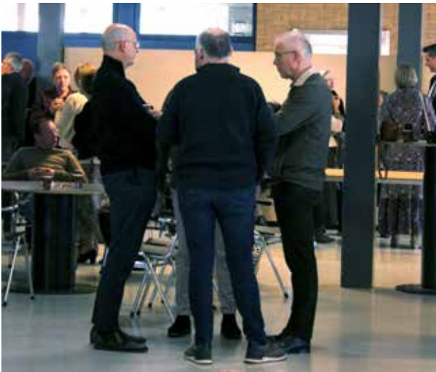
Betrokken ondernemers zijn ook naar Hoevelaken gekomen