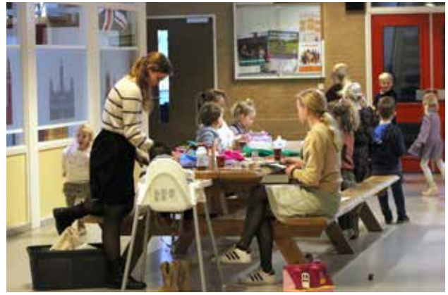
Ook aan de kinderen is gedacht