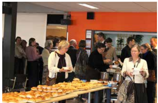
Als afsluiting werd een heerlijke lunch aangeboden