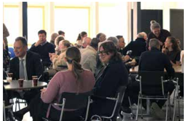
Een gezellig en samenbindend samenzijn